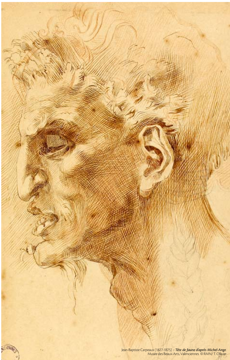
Jean-Baptiste Carpeaux (1827-1875) – Tête de faune d'après Michel-Ange. Musée des Beaux-Arts, Valenciennes