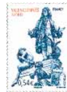
4. Musée des Beaux-Arts de Valenciennes

Avec son patrimoine artistique riche, la ville a bien mérité le nom "d'Athènes du Nord". Mais, Valenciennes, c'est aussi la modernité, la volonté de se tourner vers l'avenir pour le bien être de ses citoyens. Un timbre représentant "La Fontaine Watteau" (sculpture réalisée par trois figures emblématiques de Valenciennes, Antoine Watteau, Jean-Baptiste Carpeaux et Ernest Hiolle) rend hommage et salue le travail exceptionnel de requalification urbaine entrepris dans la cité et ce dans le plus strict respect des patrimoines culturel, artistique et religieux.