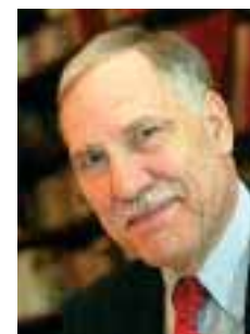
Dominique RIQUET Maire de Valenciennes Conseiller régional Nord - Pas-de-Calais

Elle se présente à vous dans cette plaquette forte de l'énergie de tous ses habitants, tournée vers le futur et la poursuite de son développement.