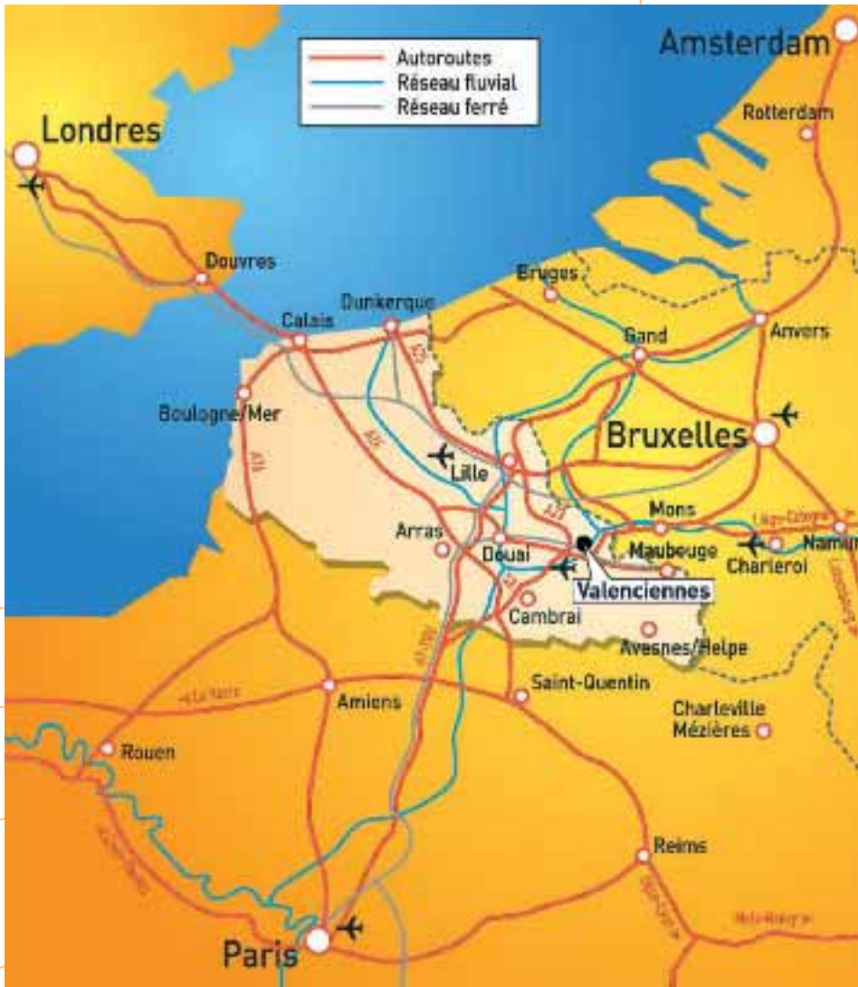
Situation géographique de la ville de Valenciennes