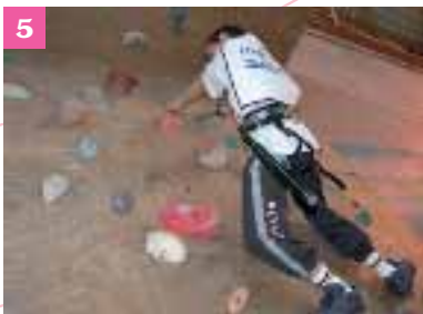
3. Séance d'entraînement au VAFC 4. Golf de Valenciennes 5. Le mur d'escalade

et leur propose un programme particulièrement riche : peinture, graphisme, volume, photographie, vidéo.... Pour les adolescents et les adultes, ce sont des cours d'histoire de l'art, d'histoire de l'architecture, de photographie, de sérigraphie et d'approche multimédia qui sont dispensés. Enfin, la bibliothèque de l'école, les conférences favorisent les échanges et les rencontres artistiques.